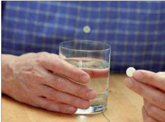
Abb. 1: Einfache Handhabung: Eine Stunde vor der Behandlung muss der Patient das Sedativum in Form einer Tablette einnehmen.