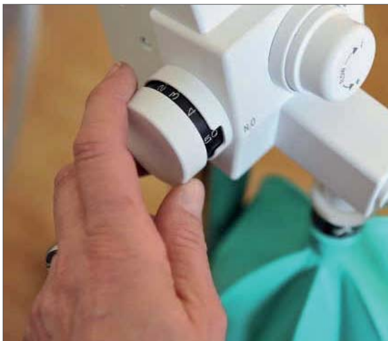
Abb. 3: Bei der Lachgassedierung kann der Zahnarzt die Sedierungstiefe während der Behandlung je nach Bedarf anpassen

nicht notwendig, wenn auch viele Zahnärzte eine intraoperative Überwachung mit einem Pulsoximeter bevorzugen.