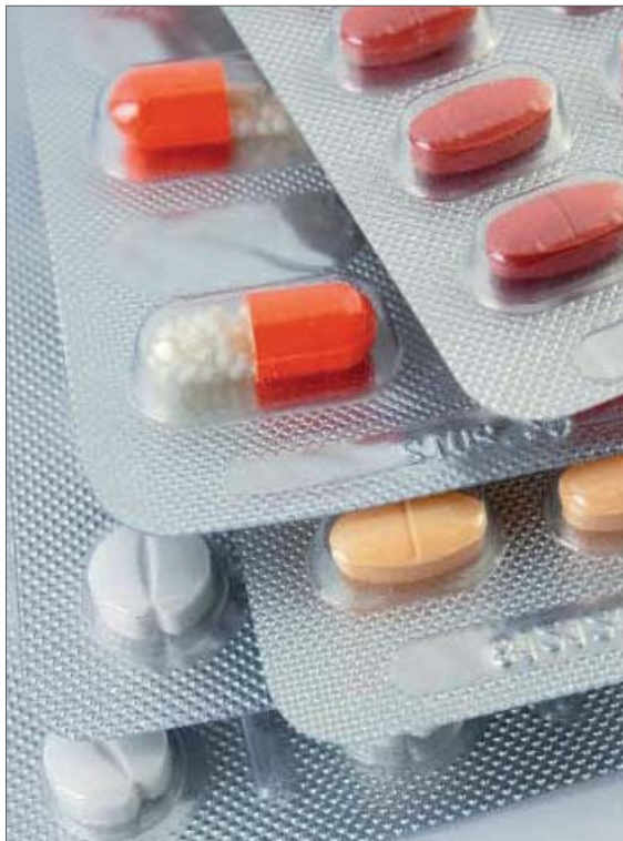
Abb 4: Die Palette an verfügbaren Medikamenten zur oralen zahnärztlichen Sedierung ist groß.

Eine Latenzphase zwischen Einnahme und Wirkung muss eingehalten werden und erfordert eine entsprechende Planung im Behandlungsablauf. Die Medikamente sind nicht titrierbar, so dass eine bedarfsgerechte Anpassung der Sedierungstiefe, wie zum Beispiel bei der Lachgasapplikation, nicht ohne Weiteres möglich ist. Eine Vorhersage, ob der Patient eine Anxiolyse hat oder nicht, kann ebenso wenig getroffen werden wie eine Aussage über die Wahrscheinlichkeit, dass der Patient in eine tiefe Sedierung hineinrutscht. Der Zahnarzt benötigt spezielle pharmakologische Kenntnisse über die eingesetzten Sedativa. Wirkung, Nebenwirkungen, Arzneimittelinteraktionen, Kontraindikationen und Dosierungsrichtlinien müssen im Detail als aktives Wissen zur Verfügung stehen.